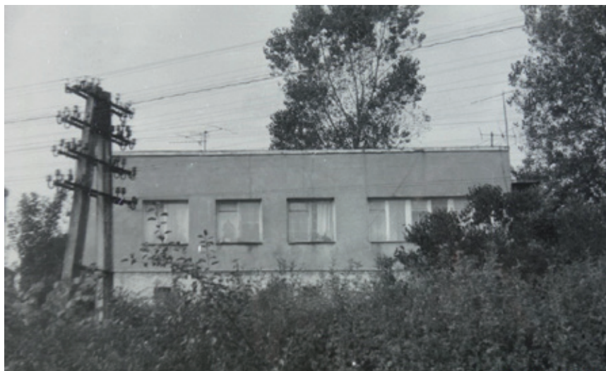
Agronomówka – obecnie apteka