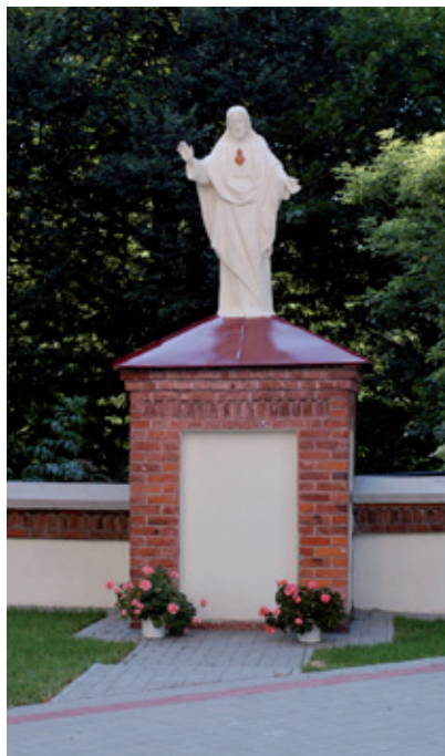
Figura Pana Jezusa przed i po renowacji