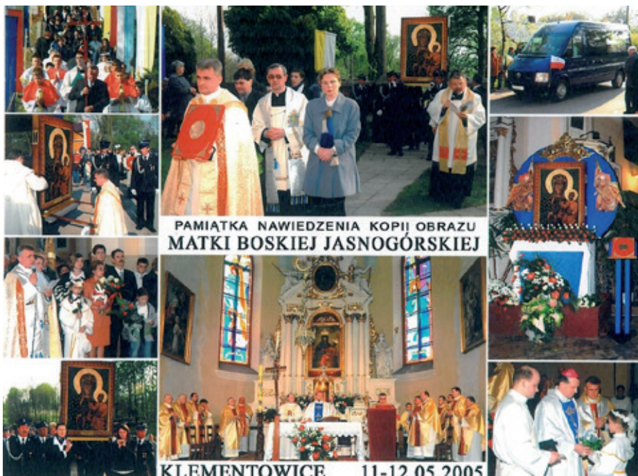
PAMIĄTKA NAWIEDZENIA KOPIJ OBRAZU MATKI BOSKIEJ JASNOGÓRSKIEJ