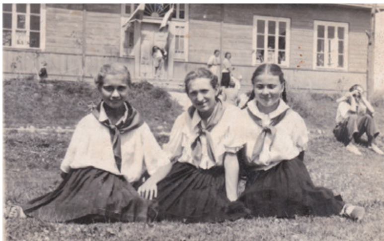
Uczennice Szkoły Podstawowej w Klementowicach