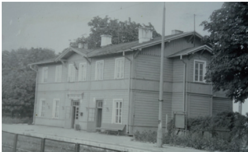
Budynek stacji kolejowej w Klementowicach