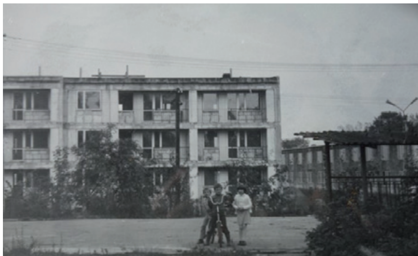
Budynek mieszkalny przy ZSA