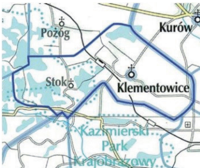
Mapa parafii Klementowice

Dziś Klementowice są największą wsią należącą do gminy Kurów. Obecnie do Parafii Klementowice należy ok. 2526 wiernych. Funkcję proboszcza pełni ks. Zbigniew Fidut.