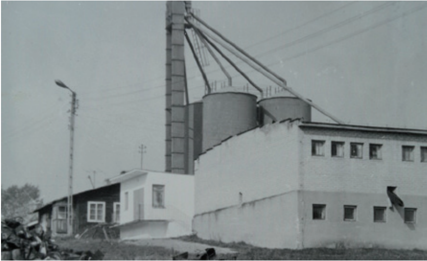
Magazyn zbożowy w GS Klementowice