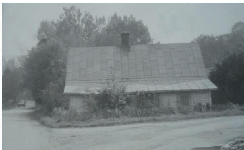
Budynek mieszkalny przy ZSA