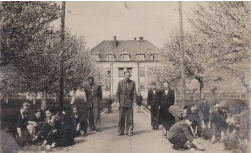
Uczniowie szkoły rolniczej w Klementowicach